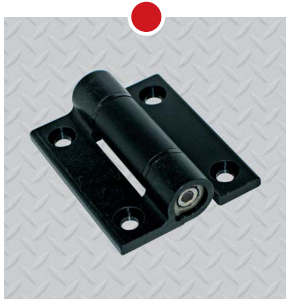
Rastscharnier Hi-Klik™ 72-1-4197, 72-1-4198 und 72-1-4225